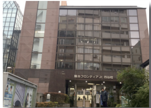
■ 四谷学習センター