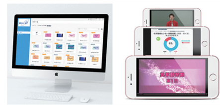
映像講座「サテネット21」

※受講料・・・1講座年間72,000円(半期36,000円)+テキスト代(年間約4,000円)