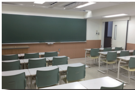
■ スクーリング教室