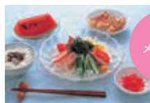
季節のメニュー例