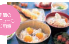
季節のメニュー例